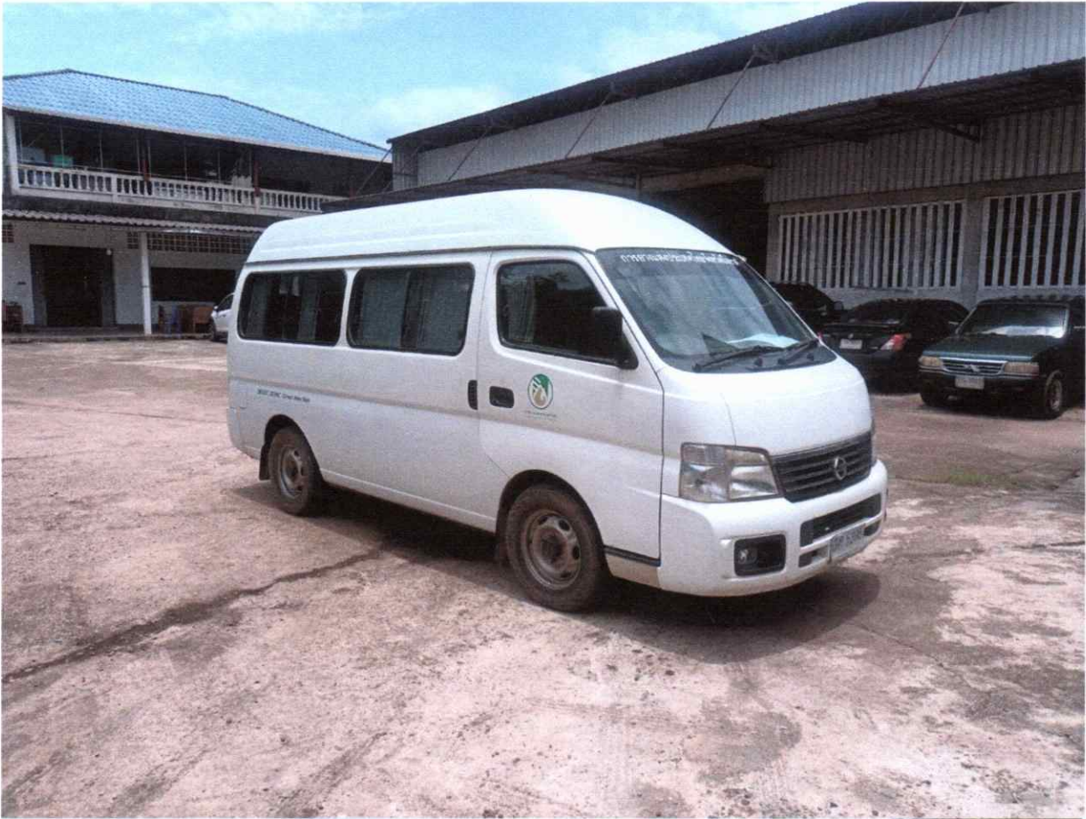
ภาพประกอบการขายทอดตลาด รถยนต์ส่วนบุคคล หมายเลขทะเบียน ฮค ๕๓๐๕ กทม. การยางแห่งประเทศไทยจังหวัดบึงกาฬ