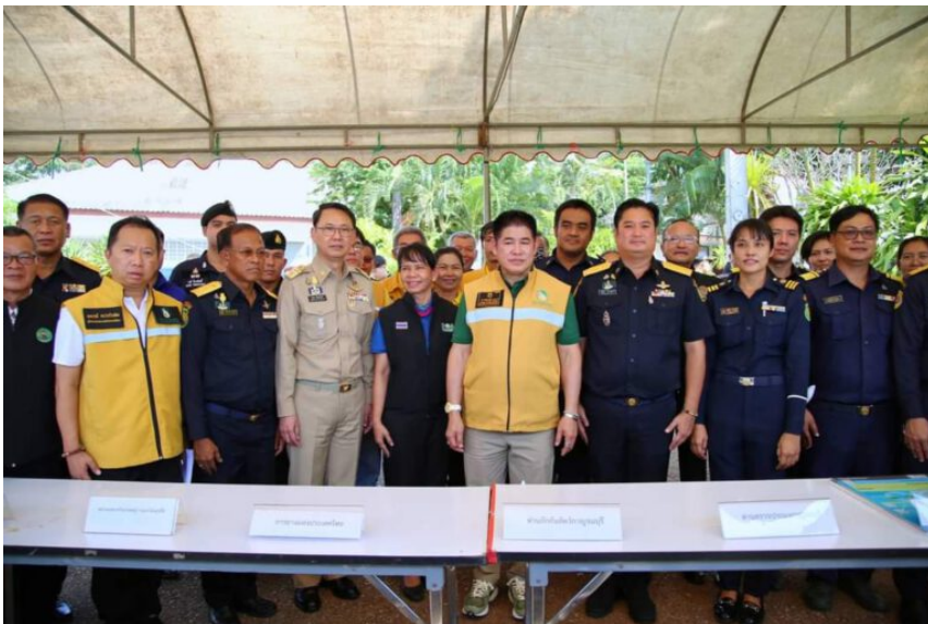
“รมว.ธรรมนัส” เปิดจุดตรวจสินค้าเกษตรแบบบูรณาการ อ.สังขละบุรี จ.กาญจนบุรี มุ่งสกัดกั้นสินค้าเกษตรผิดกฎหมาย โดยเฉพาะสินค้า “ยางพารา”

( https://missionthailand.online/?p=15271 )