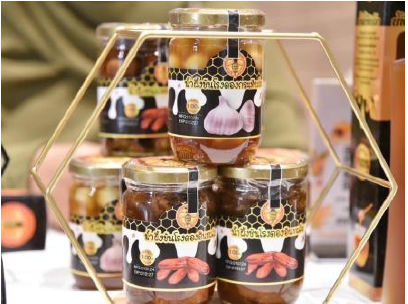
Department of Trade Negotiations กรมเจรจาการค้าระหว่างประเทศ