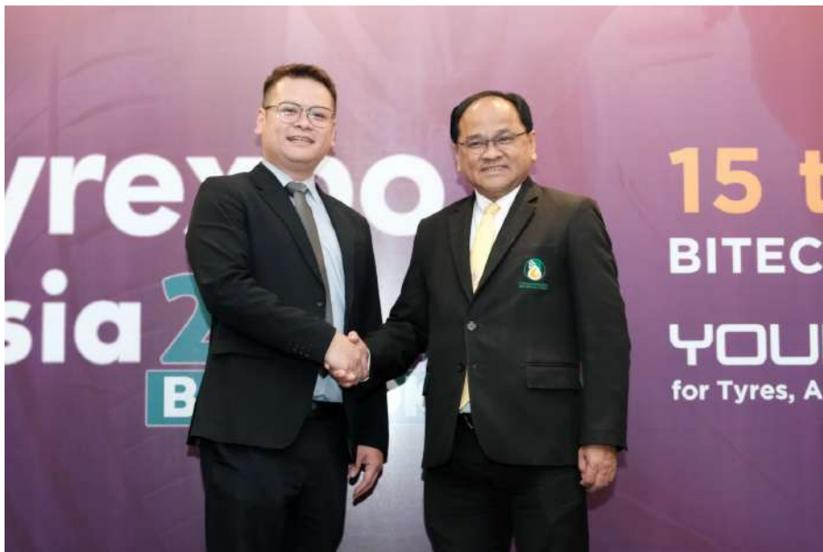
อินฟอร์มา - ทาร์ซัส กรุ๊ป ผนึก การยางแห่งประเทศไทย จัดงาน "TyreXpo Asia 2024" วางเป้าพาไทยสู่ HUB อุตสาหกรรมยางในอาเซียน

อินฟอร์มา มาร์เก็ตส์ ประเทศไทย ผนึกกำลัง ทาร์ซัส กรุ๊ป พร้อมด้วยภาคีเครือข่ายภาคอุตสาหกรรมยาง นำโดย การยางแห่งประเทศไทย (กยท.) ร่วมกันจัดงาน "TyreXpo Asia 2024" ไทรี เอ็กซ์โป เอเชีย 2024 งานแรกในไทยที่รวบรวมอุตสาหกรรมยางล้อยกระดับนานาชาติแบบครบวงจร วางเป้าเสริมแกร่งผู้ประกอบการตามนโยบายภาครัฐในการส่งเสริมอุตสาหกรรมยางไทย เปิดเวทีเจรจาธุรกิจ เชื่อมโอกาสทางการค้าและสร้างเครือข่ายให้กับห่วงโซ่อุปทานอุตสาหกรรมยางไทยแบบครบวงจร พร้อมจัดงานครั้งแรกในไทยระหว่างวันที่ 15 - 17 พฤษภาคม 2567 ที่ศูนย์นิทรรศการและการประชุมไบเทค