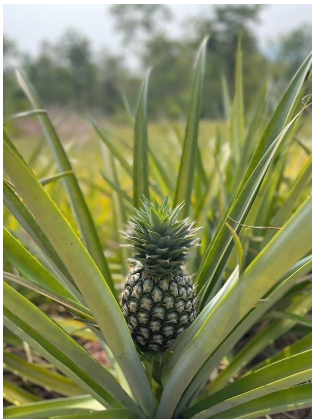
บันทึกโดย : Admin วันที่ : 08 ต.ค. 2567 เวลา : 12:53:28