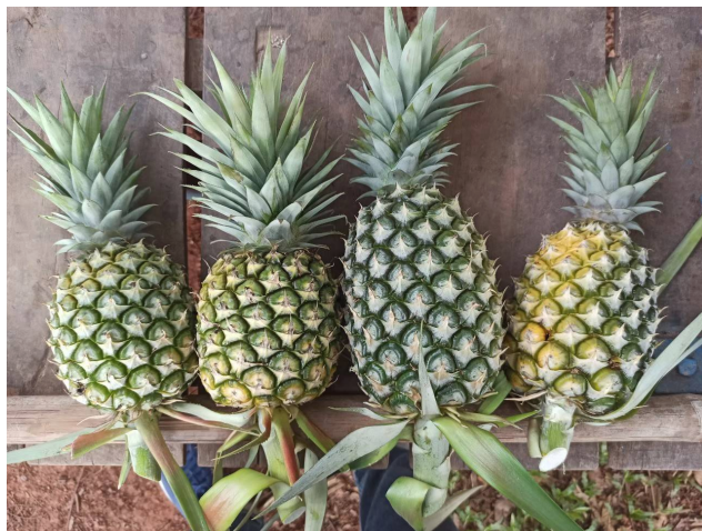
ภาพรวมทั้ง 17 จังหวัดภาคเหนือ พบว่า ขวัญนาปี ปีเพาะปลูก

อัปเดตล่าสุดเมื่อ October 8, 2024, 4:14 pm