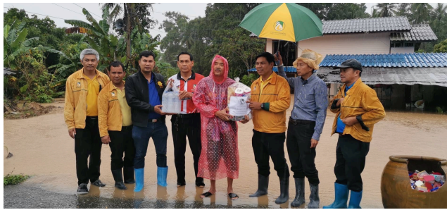
บันทึกโดย : Admin วันที่ : 29 พ.ย. 2567 เวลา : 13:10:38