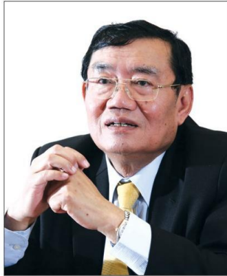
• อำนวย ปะติเส

นายกฯ คาดโทษ สั่งย้ายทุกฝ่าย เกียรติว่าง งานไม่เดิน”