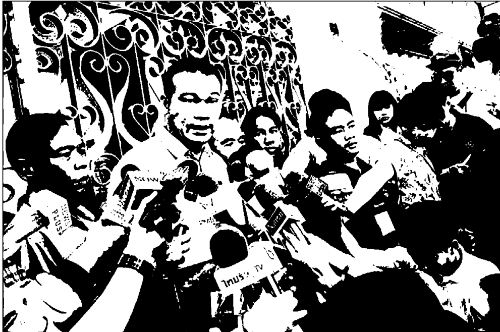
ตัวแทนชาวสวนยางที่มายื่นข้อเรียกร้องที่ทำเนียบรัฐบาล