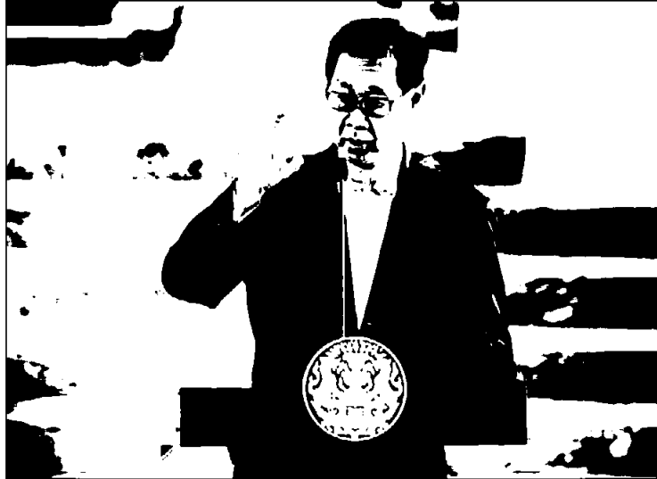
ม.ร.ว.ปรีดิยาธร เทวกุล รองนายกรัฐมนตรีด้านเศรษฐกิจ