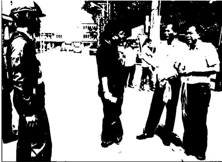
การประชุมของชาวสวนยางเพื่อเรียกร้องให้รัฐบาลแก้ปัญหาราคาคาดต่ำ ซึ่งเกิดขึ้นในหลายพื้นที่

ข้อเท็จจริงตรงนั้นปรากฏ แต่ให้มีการตรวจสอบแล้ว ปัญหาเรื่องราคายางพาราคาดต่ำที่กำลังเป็นอยู่นี้ ถึงแม้หลวงลุงกำหนดจะขอร้องให้ใจเย็น และรัฐบาล พล.อ.ประยูรฯ จะเข้มมาตรการออกมากช่วยบรรเทาปัญหา เช่น ระบายสินค้าแก่กันไว้ละพันไม่เกินรายละ 15 ไร่ อีกทั้งมีมาตรการที่รัฐบาลจะจัดหาแหล่งเงินปล่อยสินเชื่อแก่สหกรณ์และออสย.เข้าเพื่อมารับซื้อเพื่อลดราคายางให้เพิ่มสูงขึ้น แต่ดูเหมือนว่าจะยังไม่เป็นไปตามที่กลุ่มเกษตรกรชาวสวนยางต้องการ ไม่ว่าจะป็นราคายางที่ยังไม่ขยับ แหล่งเงินที่จะนำมาช่วยเหลือที่ยังติดขัด ลามเลยไปถึงการยื่นขอเรียกร้องให้เปลี่ยนตัวผู้รับผิดชอบเรื่องอีกด้วย