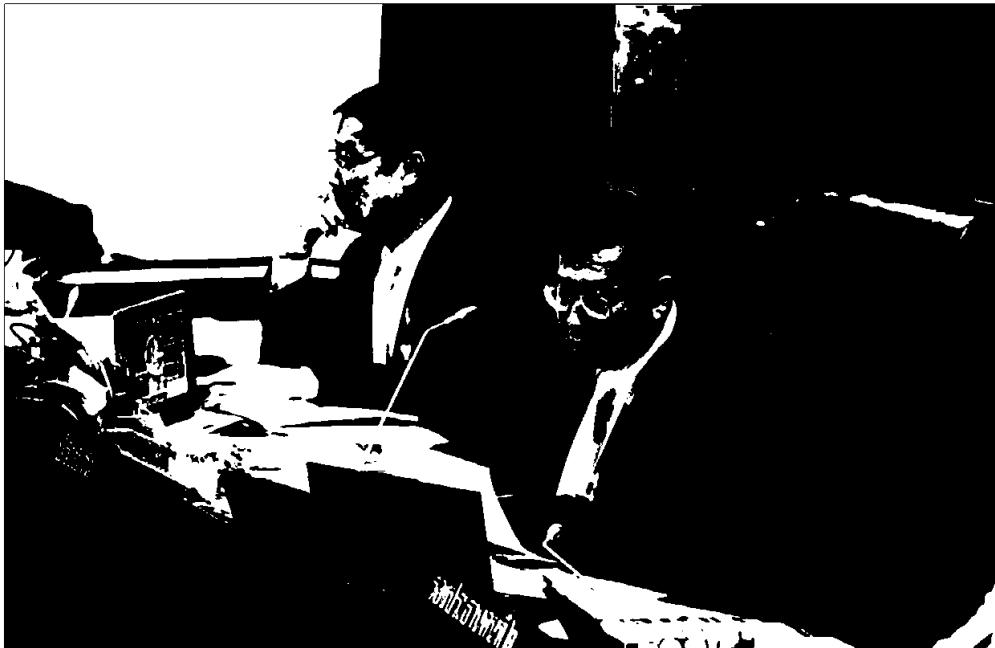
นายพรเพชร วิชิตชลชัย ประธานสภานิติบัญญัติแห่งชาติ (สนช.) เป็นประธานการประชุม สนช. วันที่ 11 ธ.ค. 57 เพื่อพิจารณาร่าง พ.ร.บ.การยางแห่งประเทศไทย

แม้จะมีเสียงคัดค้านจากเกษตรกรผู้ทำสวนยางมาก่อนหน้านี้ แต่ร่างพระราชบัญญัติ (พ.ร.บ.) การยางแห่งประเทศไทย พ.ศ. ... ที่คณะรัฐมนตรีเป็นผู้เสนอ ก็ผ่านการพิจารณาของสภานิติบัญญัติแห่งชาติ (สนช.) ในวาระแรก ด้วยคะแนนท่วมท้น 174 ต่อ 1 เสียง เมื่อวันที่ 11 ธ.ค. ที่ผ่านมา