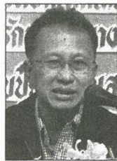
เชาว์ ทรงอาวุธ

โดยในส่วนของนักวิชาการ ได้ให้ความเห็นเกี่ยวกับปริมาณยางที่ใช้ในประเทศยังมีการใช้น้อยเพียงร้อยละ 14 ของปริมาณยางทั้งหมด ที่เหลือส่งออกขายในตลาดต่างประเทศ ทำให้ต่างชาติเป็นผู้กำหนดราคา ดังนั้น หากต้องการให้ราคาของยางไทยมีความเสถียรภาพ และมั่นคงมากขึ้น จะต้องมียุทธศาสตร์เพิ่มปริมาณการใช้อย่างในประเทศให้เพิ่มขึ้นด้วย ในการกำหนดยุทธศาสตร์พัฒนาของยางพาราของรัฐบาล”