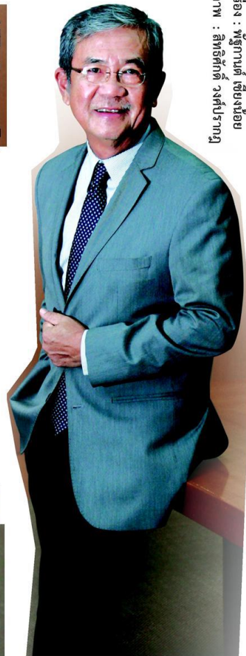
เรื่อง : ฐานเศรษฐกิจ ออกแบบ : จอห์น

“ปีติพงศ์” ทิ้งท้ายว่า รัฐบาลชุดนี้พยายามฟังปัญหา และพยายามช่วยเหลือเต็มที่ แต่ รัฐบาลช่วยอย่างเดียวไม่พอ เกษตรกรต้องเข้าใจปัญหา และต้องช่วยตัวเองและรัฐบาลด้วย ถ้าช่วย กันรักษาระเบียบ ก็ทำให้ทุกอย่างผ่านไปได้ สิ่งที่เขาเชื่อมั่นคือ เกษตรกรไทยเป็นคนเก่ง ถ้าทุกฝ่าย ร่วมมือกัน ไม่มีอะไรที่เราฝ่าฟันไปไม่ได้ ความหวังในการปรับปรุงอาชีพ การเข้าไปเป็นส่วนหนึ่ง ของห่วงโซ่อุปทาน คือ เป็นเจ้าของธุรกิจบ้าง ปรับปรุงสินค้า เพิ่มมูลค่าให้มันดีขึ้น ความหวังยังมี อยู่ ไม่ใช่ไม่มีหวัง เพียงแต่เราต้องฝ่าฟันวิกฤติไปด้วยกัน