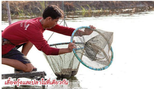
เลี้ยงกุ้งและปลาในทีเดียวกัน

ในปี 2558 นี้ มีเกษตรกร สถาบันเกษตรกรและสหกรณ์ดีเด่น ที่ได้รับการคัดเลือก จะได้รับพระราชทานโล่รางวัลในงานพระราชพิธีพืชมงคลจรดพระนังคัลแรกนาขวัญ ประจำปี พ.ศ. 2558 ในวันที่ 13 พฤษภาคม 2558 ณ พิธีพลพลาที่ประทับมณฑลพิธีท้องสนามหลวง