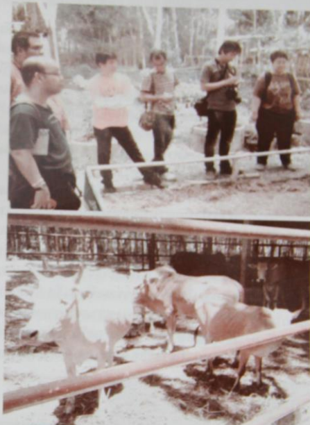
การเลี้ยงวัวในสวนยางของศูนย์เรียนรู้เศรษฐกิจพอเพียง

นอกจากนั้น ทางศูนย์ยังมีการเพาะเห็ด ผลิตน้ำจุลินทรีย์ หรือ EM เพื่อช่วยปรับสภาพความสมดุลของสิ่งมีชีวิตและสิ่งแวดล้อม เช่น การรักษาสภาพน้ำในบ่อเลี้ยงปลา หรือนำไปใช้ในการล้างตลาด ล้างห้องน้ำ ซึ่งจะช่วยกำจัดกลิ่นเหม็น ลดจำนวนสัตว์และแมลงพาหะนำโรค รวมทั้งช่วยไล่แมลง แรงพิษผลต่างๆ ให้เติบโตเร็วขึ้น