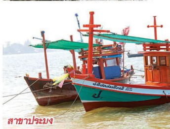
สาขารประมง