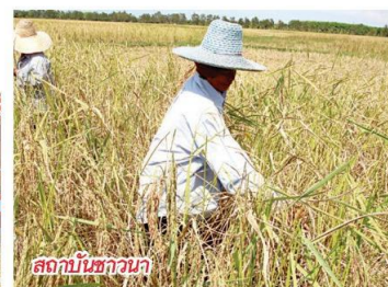
สถาบันชวนา