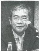
ปิติพงศ์ พึ่งบุญ ณ อยุธยา

นายปิติพงศ์ พึ่งบุญ ณ อยุธยา รัฐมนตรีว่าการกระทรวงเกษตรและสหกรณ์ เปิดเผยว่า เมื่อวันที่ 14 พฤษภาคมที่ผ่านมา สภานิติบัญญัติแห่งชาติ (สนช.) ได้พิจารณาผ่านร่าง พ.ร.บ. การยางแห่งประเทศไทยเรียบร้อยแล้ว และจะได้นำเสนอเพื่อลงพระปรมาภิไธยและประกาศใช้เป็นกฎหมายต่อไป ถือว่าเป็นความสำเร็จของรัฐบาลที่ผ่านกฎหมายนี้สำเร็จ เนื่องจากได้มีความพยายามที่จะผ่านกฎหมายนี้มาเป็นเวลานาน 10 ปี กระทรวงเกษตรและสหกรณ์ ต้องขอขอบคุณ พล.อ.ประยุทธ์ จันทร์โอชา นายกรัฐมนตรี รัฐบาล สภานิติบัญญัติแห่งชาติ และกรมการที่ได้ช่วยตรวจร่างอย่างรวดเร็ว รอบคอบ และมีประสิทธิภาพ ซึ่งเมื่อกฎหมายมีผลบังคับใช้ก็จะทำให้การบริหารงานยางธรรมชาติเป็นไปอย่างครบวงจร ทั้งด้านการผลิต การจำหน่าย งานวิชาการ ทำให้การดำเนินงานของเจ้าหน้าที่ที่จะสนับสนุนการปลูกยาง การเพิ่มผลผลิต และการใช้ยางธรรมชาติ เกิดประโยชน์อย่างบูรณาการและมีประสิทธิภาพมากขึ้น