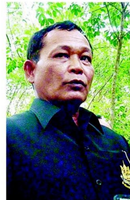
พล.อ.ดาว์พงษ์ รัตนสุวรรณ