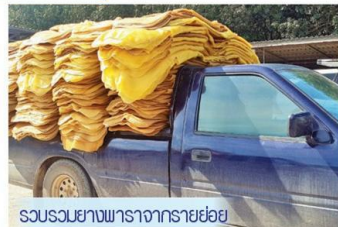
ส่งมอบยางพาราจากรายย่อย