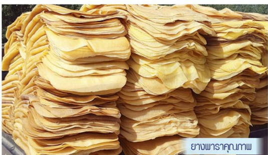
ยางพาราคุณภาพ

สหกรณ์ กล่าวว่า ทั้งนี้ที่พระราชบัญญัติการยางแห่งประเทศไทยประกาศบังคับใช้จะมี 3 หน่วยงานยางพาราที่ต้องยุติบทบาทและยุบรวมกัน ได้แก่ สำนักงานกองทุนสงเคราะห์การทำสวนยาง (สทย.) องค์การสวนยาง และสถาบันวิจัยยาง กรม