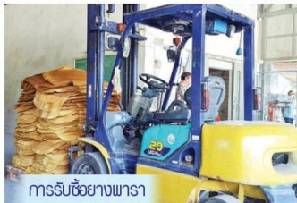
การรับซื้อยางพารา

นอกจากนี้ ยังเตรียมความพร้อมบริหารจัดการกองทุนพัฒนายางพารา โดยจัดสรรเงินกองทุนฯ เพื่อวัตถุประสงค์ 6 ข้อ คือ 1. ใช้เพื่อบริหารจัดการองค์การ 10% 2. ใช้สนับสนุนการศึกษาวิจัยยางพารา 5% 3. ใช้เพื่อส่งเสริมการปลูกแทน 40% 4. ใช้เพื่อส่งเสริมการแปรรูปผลิตภัณฑ์ยางเพื่อเพิ่มมูลค่า ส่งเสริมการใช้ภายในประเทศ พัฒนาระบบตลาดและการขนส่ง และรักษาระดับราคาขายให้มีเสถียรภาพ 35% 5. สวัสดิการเกษตรกรชาวสวนยาง 7% และ 6. ใช้เพื่อส่งเสริมสนับสนุนสถาบันเกษตรกร 3%