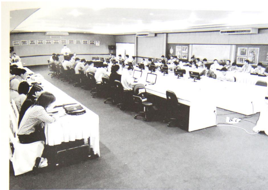
พนักงานกองทุนสงเคราะห์การทำสวนยาง เข้าร่วมการฝึกอบรมหลักสูตร ตลาดยางและมาตรฐานการคัดคุณภาพยาง

วารสาร ยางพารา ปีที่ 36 ฉบับที่ 1 เดือน มกราคม-มีนาคม 2558 หน้า 47