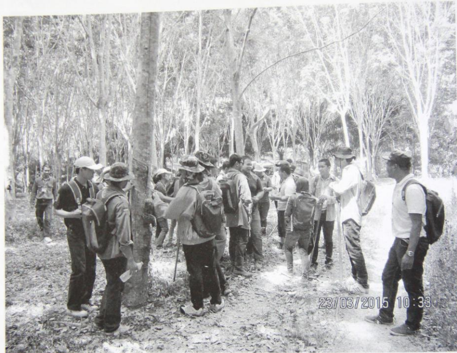
พนักงานกองทุนสงเคราะห์การทำสวนยาง เข้ารับการฝึกอบรมหลักสูตร โรคและศัตรูยาง

คน รุ่นที่ 2 ระหว่างวันที่ 14 - 16 มีนาคม 2558 ณ ศูนย์เรียนรู้ยางพาราจังหวัดกระบี่ จังหวัดกระบี่ มีผู้เข้าอบรม 40 คน รุ่นที่ 3 ระหว่างวันที่ 18 - 20 มีนาคม 2558 ณ ศูนย์เรียนรู้ยางพาราจังหวัดพัทลุง จังหวัดพัทลุง มีผู้เข้าอบรม 43 คน รุ่นที่ 4 ระหว่างวันที่ 21 - 23 มีนาคม 2558 ณ ศูนย์เรียนรู้ยางพาราจังหวัดกระบี่ จังหวัดกระบี่ มีผู้เข้าอบรม 39 คน