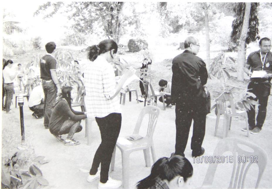
พนักงานกองทุนสงเคราะห์การทำสวนยาง เข้าร่วมการฝึกอบรมหลักสูตร พันธุ์ยางและการจำแนกพันธุ์ยาง