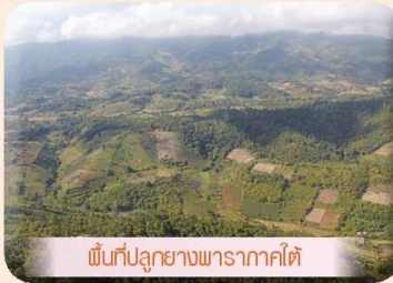
พื้นที่ปลูกยางพาราคาดไฟ

ของเกษตรกรผู้ปลูกยางพาราท่ามกลางวิกฤติราคายางพาราตกต่ำ ในจังหวัดสงขลา ปี 2558 ว่า หลังจากที่ราคายางพาราตกต่ำอย่างต่อเนื่อง ยังผลให้เกษตรกรเริ่มมีการปรับตัวมากขึ้น