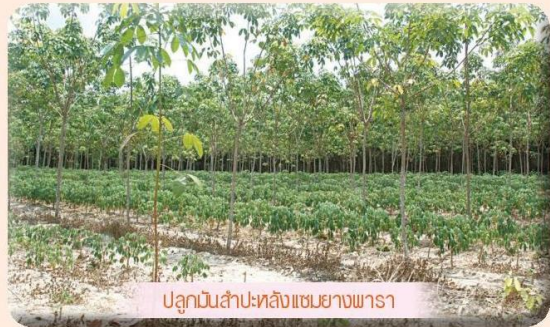
ปลูกไม้ป่าหลังแซมยางพารา

ทั้งนี้สวนยางพาราของจังหวัดสงขลานั้นมีพื้นที่ปลูก (ข้อมูลปี 2557) จำนวน 2,066,960 ไร่ พื้นที่กรีดยาง 1,665,037 ไร่ ผลผลิตรวมทั้งจังหวัดมีปริมาณ 501,008 ตัน และมีผลผลิตต่อไร่ 290 กก./ไร่ ผลการศึกษพบว่า เกษตรกรได้ปรับตัวเพื่อการอยู่รอดในสถานการณ์วิกฤติราคายางพาราตกต่ำใน 4 ด้าน