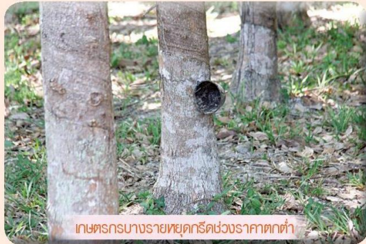
เกษตรกรบางรายหยุดกรีดยางพาราตกต่ำ