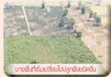
บางพื้นที่เริ่มเปลี่ยนไปปลูกพืชชนิดอื่น