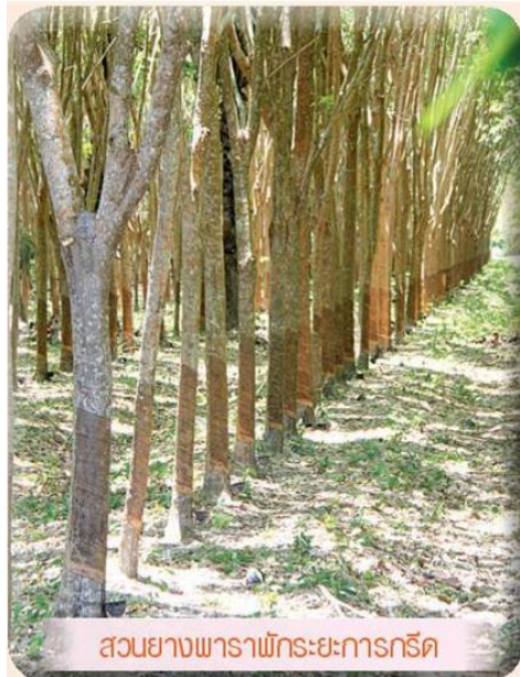
สวนยางพาราพักระยะการกรีดยาง

อาชีพเสริมเพื่อเพิ่มรายได้ได้แก่ อาชีพรับจ้างทั่วไป ขายของในตลาดนัดและรับเหมาก่อสร้าง ทำให้มีรายได้จากอาชีพเสริมนี้เฉลี่ยครัวเรือนละ 73,250 บาทต่อปี แต่มีเกษตรกรร้อยละ 75 ที่ไม่มีการปรับตัวในการเพิ่มรายได้นอกภาคการเกษตร