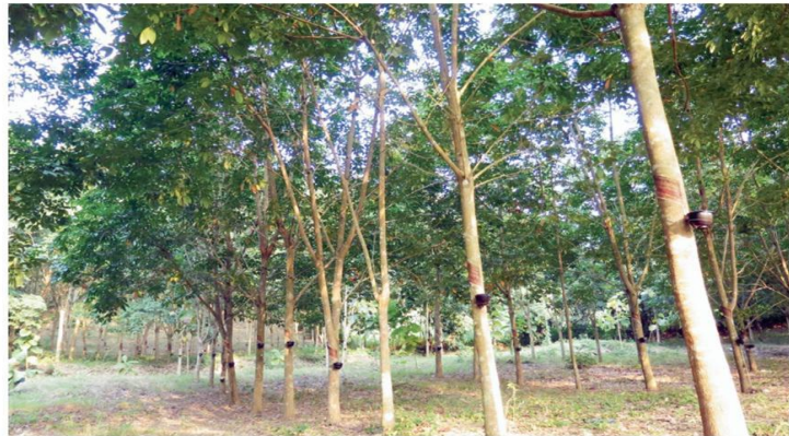
ต้นแบบ - ชาวสวนยาง 4 อำเภอของนครศรีธรรมราชรวมตัวกันตั้งโรงงานผลิตยางแท่ง และยางคอมพาวนด์ นอกจากจะได้ราคาขายยางสูงขึ้นแล้ว ยังมีสิทธิได้เงินปันผลหาก ร่วมถือหุ้น อีกทั้งปีประตูเสี่ยงด้วยการตั้งกลุ่มธรรนำทิพย์และ อ.ก.ส.มาร่วมถือหุ้นใหญ่

เหตุที่รวมกลุ่มกันตั้งโรงงาน เนื่องจาก ปัญหาราคายางพาราทกต่ำอย่างต่อเนื่อง ตั้งแต่ปี 2555 ส่งผลให้เกิดการชุมนุมเรียกร้องต่อรัฐบาลให้ช่วยเหลือเกษตรกรชาวสวน ยาง ทั้งในรูปแบบของการประกันราคา และอุดหนุนปัจจัยการผลิต แต่เป็นการแก้ ปัญหาเฉพาะหน้าในระยะสั้นและไม่ยั่งยืน เนื่องจากไทยส่งออกยางพาราในรูปแบบ วัตถุดิบต้นน้ำ ไม่ได้เพิ่มมูลค่า ทำให้ได้ ราคาไม่สูง ประกอบกับการส่งเสริมการ