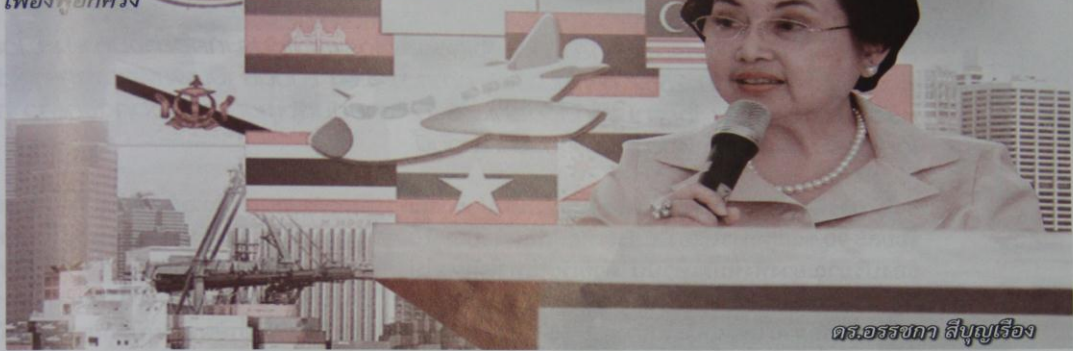
ดร.อรรชกา สีบุญเรือง

*** ในต้นปี 2559 ประเทศไทยและอีก 9 ประเทศในภูมิภาคเอเชียตะวันออกเฉียงใต้จะรวมตัวเข้าสู่ประชาคมเศรษฐกิจอาเซียน (AEC) อย่างเต็มตัว ถือเป็นทั้งโอกาสและความท้าทายต่อวงการอุตสาหกรรมไทย ในการนำรายได้เข้าสู่ประเทศจากการส่งสินค้าและผลิตภัณฑ์อุตสาหกรรมออกไปขายในตลาดอาเซียน “ดร.อรรชกา สีบุญเรือง” ปลัดกระทรวงอุตสาหกรรมบอกว่า อาเซียนเป็นอีกหนึ่งตลาดที่มีกำลังซื้อมากที่สุดแห่งหนึ่งของโลก เนื่องจากมีจำนวนประชากรรวมกว่า 600 ล้านคน มีมูลค่าผลิตภัณฑ์มวลรวม 10 ประเทศสมาชิก รวมกันสูงถึง 2 ล้านล้านดอลลาร์สหรัฐ หรือราว 62 ล้านล้านบาท จึงขึ้นอยู่กับว่า ประเทศไทยและรัฐบาลจะยกศักยภาพและขีดความสามารถผู้ประกอบการอุตสาหกรรมไทยได้มากน้อยแค่ไหนในเวลาที่เหลือ หากทำได้สำเร็จ นอกจากก้าวขึ้นสู่การเป็นผู้นำกลุ่มประเทศอาเซียนแล้วก็ย่อมส่งผลดีให้เศรษฐกิจไทยกลับเฟื่องฟูอีกครั้ง