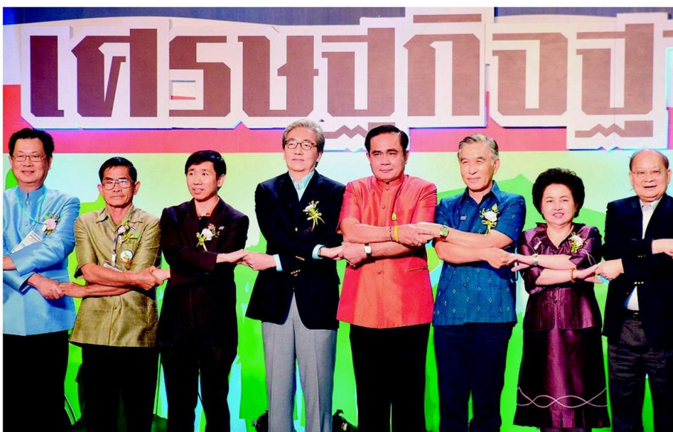
สานพลัง - พล.อ.ประยุทธ์ จันทร์โอชา นายกรัฐมนตรี และหัวหน้า คสช. เป็นประธานเปิดเวทีจุดประกายสานพลังประชารัฐเพื่อเศรษฐกิจฐานราก โดยมีนายสมคิด จาตุศรีพิทักษ์ รองนายกรัฐมนตรี ผู้นำภาคธุรกิจ เครือข่ายภาคประชาสังคม และหน่วยงานส่วนท้องถิ่น ร่วมงาน ที่อิมแพค เมืองทองธานี เมื่อวันที่ 20 กันยายน

นายสุรพงษ์ โตวิจักษณ์ชัยกุล อดีตรองนายกรัฐมนตรี พรรคเพื่อไทย (พท.) กล่าวถึงการเปิดนโยบายเศรษฐกิจประชารัฐของรัฐบาล พล.อ.ประยุทธ์ ว่า ไม่ได้ต่างกันเลยกับนโยบายประชานิยม ทั้งวิธีการดำเนินการแต่ละนโยบาย เพียงตั้งชื่อเรียกใหม่เท่านั้น เพราะที่ผ่านมามีการกล่าวหาว่าประชานิยมทำให้บ้านเมืองเสีย