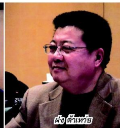
ฝง ต้าเหว่ย

ด้านการดึงดูดเม็ดเงินลงทุนจากต่างประเทศและการพัฒนาพื้นที่ศักยภาพในมณฑล โดยสนับสนุนทั้งในด้านงบประมาณและบุคลากร เพื่อที่จะไปสู่เป้าหมาย ซึ่งหนึ่งในนั้นคือ เป้าหมายด้านพลังงาน