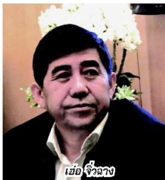
เยื่อ จิวฉาง

ซึ่งในการไปดูงานครั้งนี้ อีกมุมมองหนึ่งที่อยากนำมารายงานเป็นบทสรุปส่งท้ายก็คือ เรื่องของอนาคตธุรกิจพลังงานในมณฑลสำนซี ที่จะเป็นอีกหนึ่งธุรกิจสำคัญในการขับเคลื่อนเพื่ออนาคตในการพัฒนาพื้นที่ภาคตะวันตกของจีนนั้น เนื่องจากรัฐบาลสำนซีให้ความสำคัญใน