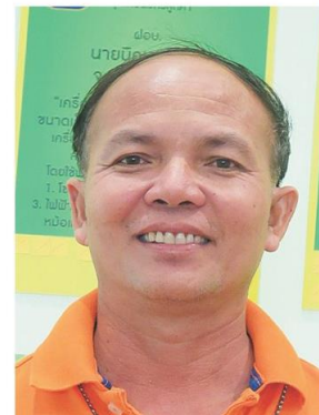
ธนาคาร จินกลาง

ธนาคารชี้ว่า ในอดีตชาวบ้านในพื้นที่โนนสุวรรณอยู่แบบตามมีตามเกิด คนแก่