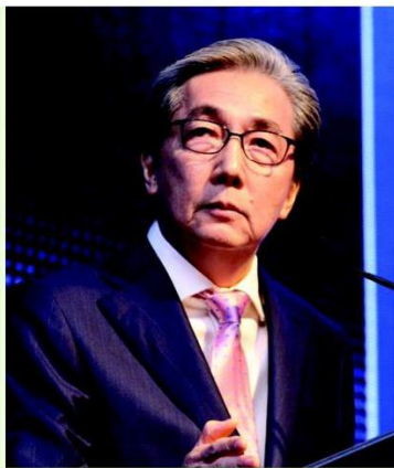
• ดร.สมคิด จาตุศรีพิทักษ์

อย่างไรก็ดีระหว่างการประชุม รัฐมนตรีเอเปก ครั้งที่ 27 ณ กรุงมะนิลา สาธารณรัฐฟิลิปปินส์ เมื่อ 17 พฤศจิกายน ที่ผ่านมา นางอภิรดี ตันตราภรณ์ รัฐมนตรี ว่าการกระทรวงพาณิชย์(พณ.) ได้มีการ หารือกับรัฐมนตรีกระทรวงพัฒนาารัสเซีย