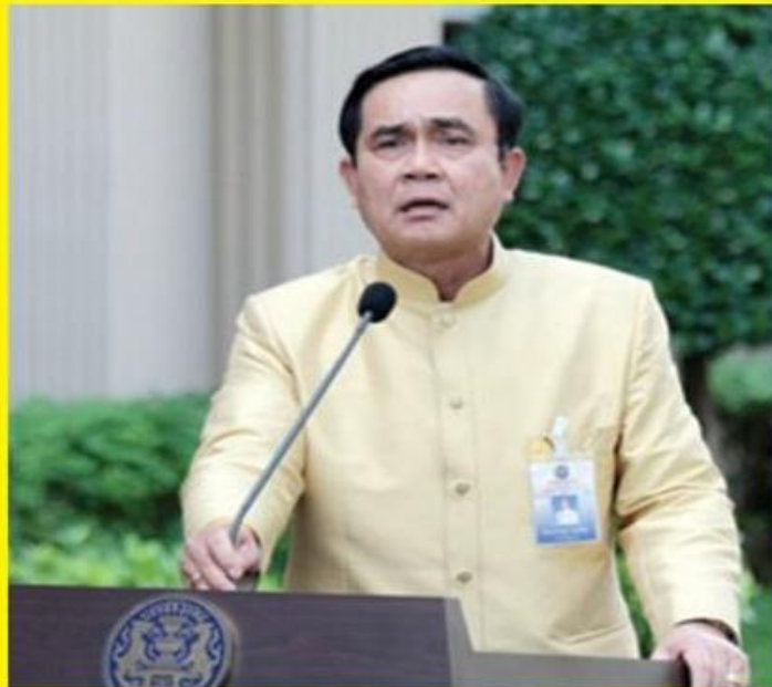
พล.อ.ประยุทธ์ จันทร์โอชา

๘ ปีกเล็ก โครงการ 30 บาท ไป เอมาย่าจ่ายค่า ยาง ค่า ชาว ให้มัน ซดเซย ไป เพราะผมมี เงิน เท่านั้น