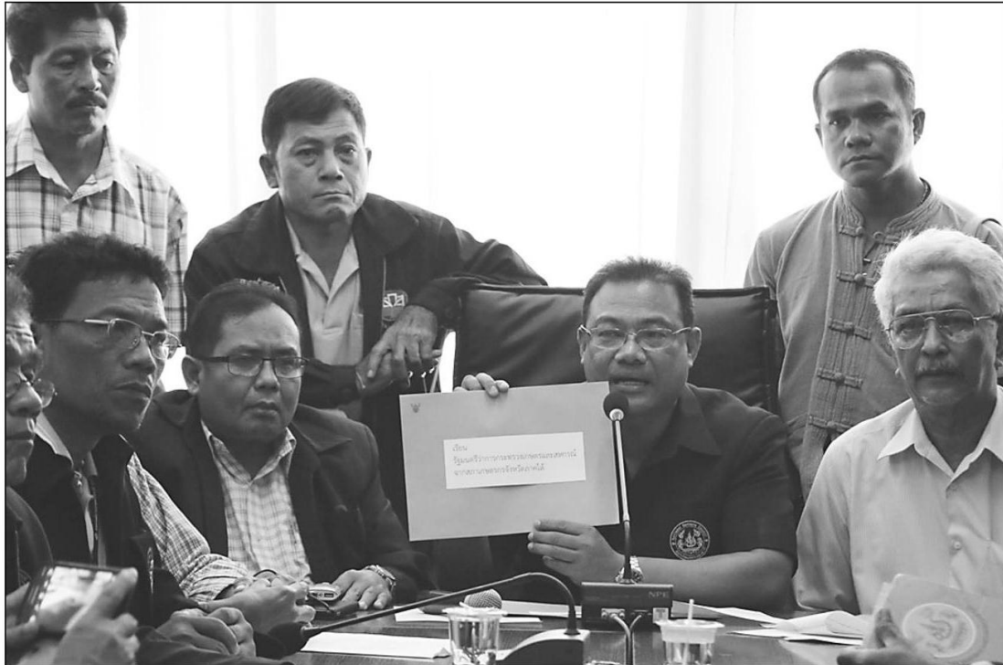
ตัวแทนสภาเกษตรกร 6 จังหวัดภาคใต้ ประกอบด้วย สงขลา พัทลุง ปัตตานี ยะลา นราธิวาส และสตูล ร่วมประชุมเพื่อหาแนวทางแก้ไขปัญหาราคายางพาราตกต่ำช่วยเหลือเกษตรกรชาวสวนยาง โดยได้ข้อสรุป 10 ข้อ ขอรับความช่วยเหลือจากรัฐบาล ที่สำนักงานสภาเกษตรกรจังหวัดสงขลา