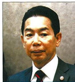
• พล.ท.อภิรัชต์ คงสมพงษ์