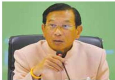
พล.อ.ฉัตรชัย สาริกัลยะ

นายเชาว์ กล่าวอีกว่า ขณะนี้ราคายางในตลาดเริ่มปรับตัวสูงขึ้นที่ 42 บาทต่อกก. โดยเป็นผลจาก