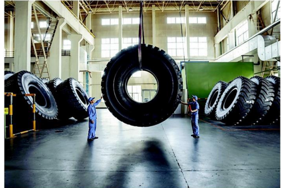
คนงานที่โรงงานไทรแองเกิลไทรในเมืองเวย์ไห่ของจีนเคลื่อนย้ายล้อยางขนาดมหึมาที่ใช้ในกิจการทำเหมือง

ต้นขึ้นอยู่กระจัดกระจายกันในป่า ขณะที่ในสวน ต้นยางขึ้นอยู่ใกล้ๆ กัน เหมือนจานอาหารบนโต๊ะบุฟเฟต์ ทำให้เชื้อรากระโดดข้ามต้นได้ง่าย การสร้างสวนยางขนาดมหึมาของพอร์ตจึงเป็นการทุ่มเงินก้อนใหญ่สร้างโรงเพาะเชื้อราขนาดยักษ์นี้เอง และพอถึงปี 1935 เหตุการณ์ที่ไม่อาจหลีกเลี่ยงก็เกิดขึ้น ต้นยางในฟอร์ดแลนด์ตายหมดภายในเวลาเพียงไม่กี่เดือน นับเป็นหายนะทางนิเวศวิทยาและความพินาศทางเศรษฐกิจอย่างใหญ่หลวง