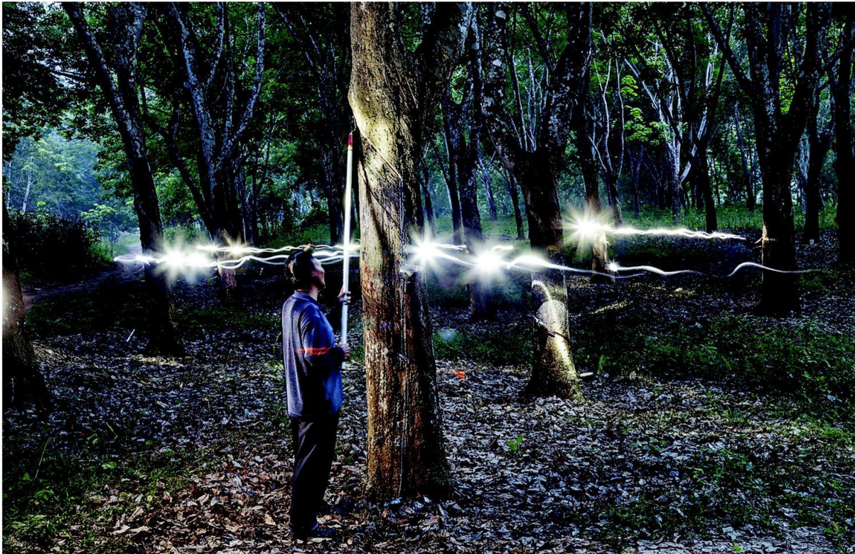
เนื่องจากน้ำยางไหลได้ดีที่สุดในเวลากลางวัน คนกรีดยางในเขตลิบสองปันนาจึงใช้ไฟฉายคาดศีรษะส่องต้นยางขณะทำงาน เฉลี่ยแล้วต้นยางหนึ่งต้นจะให้น้ำยางเดือนละประมาณสองกิโลกรัม

ความโดดเด่นช่วงท้งไกล ปัจจุบัน “ทางหลวงสาย ยางพารา” ใหม่เอี่ยมเชื่อมสวนยางที่เคยอยู่ไกล สุดกู่ในเอเชียตะวันออกเฉียงใต้เข้ากับโรงงาน ผลิตยางรถยนต์ในภาคเหนือของจีน