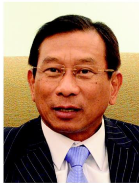
พล.อ.ฉัตรชัย สาริกัลยะ

อย่างไรก็ตาม กระทรวงเกษตรฯ ได้สั่งการและเน้นย้ำทุกขั้นตอนให้เกิดความโปร่งใส ประโยชน์เกิดกับเกษตรกรอย่างเต็มที่ หากเปิดช่องที่มีโอกาสทุจริต เชื่อมั่นว่า