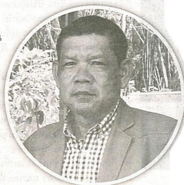
ภูมิพัฒน์ เหมือนจันทร์