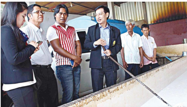
▲ตรวจเยี่ยม...นายโอกาส กลั่นบุศย์ รองปลัดกระทรวงเกษตรฯ ตรวจเยี่ยมกระบวนการรับซื้อน้ำยางพาราสดของกลุ่มวิสาหกิจชุมชน หมู่ 13 ต.เสาเกา อ.ลิซล จ.นครศรีธรรมราช พร้อมแนะนำให้ปลูกพืชชนิดอื่นแทน

ไตรภาคีจับมือดัน ยับมือลดการส่งออก ยางพารา 6.1 แสนตัน ราคาตลาดโลกพุ่ง! ไตรภาคียาง 3 ประเทศ ไทย ♦ อ่านต่อหน้า 13