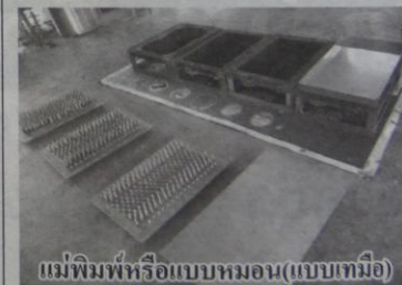
แม่พิมพ์หรือแบบหมอน(แบบเทมื่อ)