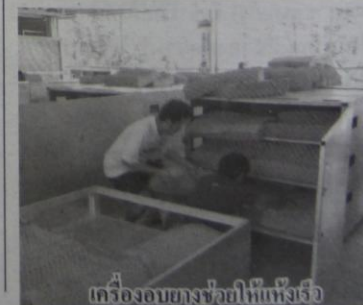
เครื่องอบยางช่วยให้แห้งเร็ว