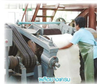
ผลิตยางเคร