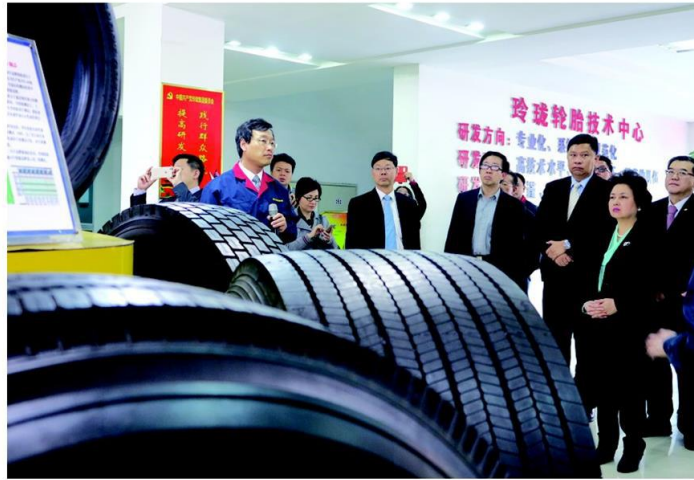
• ดูวานบริษัท หลิงหลงฯ

ผู้บริหารของหลิงหลงได้ตั้งข้อสังเกตต่อคณะโรดโชว์ของไทยว่า ไม่ได้มีเป้าหมายแค่การลงทุนเพื่อแปรรูปยางและผลิตรยางยนต์เท่านั้น แต่มองไปถึงการตั้งศูนย์วิจัยและพัฒนายางพาราในพื้นที่ใกล้ๆ กรุงเทพฯ คงไม่ลงไปตั้งที่