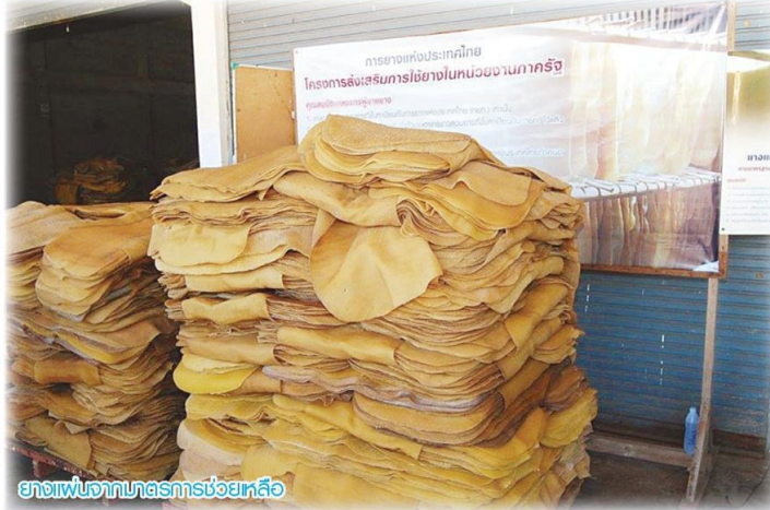
ยางแผ่นจากภาคการช่วยห่อ

ทั้งนี้ กยท. เป็นรัฐวิสาหกิจในสังกัดกระทรวงเกษตรและสหกรณ์ จัดตั้งขึ้นเมื่อวันที่ 15 กรกฎาคม 2558 ตามพระราชบัญญัติการยางแห่งประเทศไทย พ.ศ. 2558 โดยได้ยุบรวม 8 หน่วยงานคือ กองทุนส่งเสริมการทำสวนยาง องค์การสวนยาง และสถาบันวิจัยยาง เข้าด้วยกัน มีภารกิจในการบริหารจัดการยางพารา