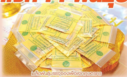
เมล็ดพันธุ์ข้าวพระราชทานเพื่อแจกเกษตรกร