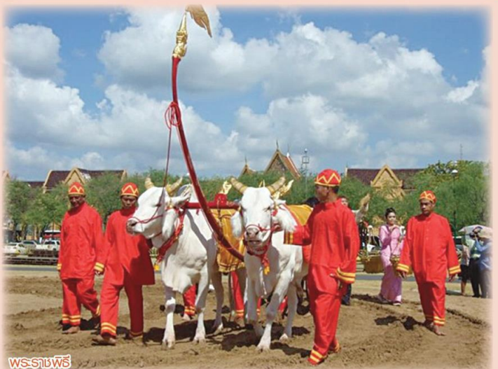
พระราชพิธี

ประกอบด้วย ข้าวนาสวน จำนวน 7 พันธุ์ ได้แก่ 1. ปทุมธานี 1 จำนวน 175 กิโลกรัม เป็นข้าวหอมนุ่ม คุณภาพเมล็ดคล้ายพันธุ์ขาวดอกมะลิ 105 ให้ผลผลิตสูงประมาณ 650-774 กิโลกรัมต่อไร่ ประกาศรับรองพันธุ์เมื่อวันที่ 30 พฤษภาคม 2548 2. ข้าวสังข์หยดพัทลุง จำนวน 42 กิโลกรัม เป็นข้าวพื้นเมืองดั้งเดิมที่ปลูกในจังหวัดพัทลุง ข้าวกล้อง