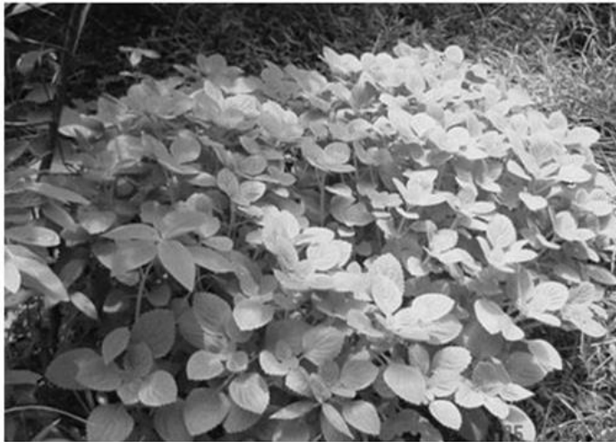
มันขี้หนู

เรียนรู้เกษตรผสมผสานประมาณช่วงเดือนสิงหาคม 2559 และจะเร่งปลูกพืชให้เต็มพื้นที่ 100% เต็ม ซึ่งขณะนี้ปลูกพืชไปแล้ว 50%