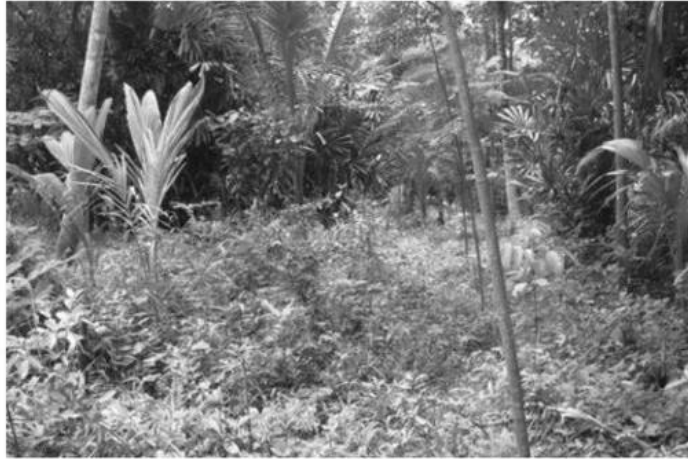
เกษตรผสมผสาน