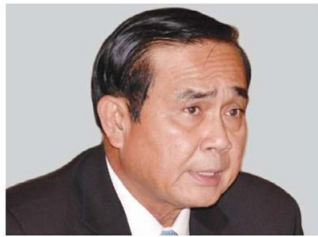
ประยุทธ์ จันทร์โอชา