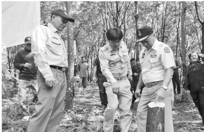
▲ ทวงคืนผืนป่า... นายสุชาติ จมพวรรณ ผวจ.หนองคาย นำทหารและหน่วยงานที่เกี่ยวข้องเข้ารื้อถอนตัดต้นยางพาราในพื้นที่เป้าหมายจำนวน 2 แปลง พื้นที่บ้านห้วยไซงัว หมู่ 5 ต.ผาดัง อ.สังคม จ.หนองคาย รวมทั้งกว่า 150 ไร่ ตามมาตรการ “พลิกผืนผืนป่าสู่การพัฒนาที่ยั่งยืน”