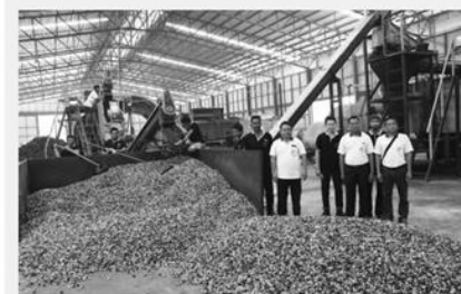
และส่งผลกับคุณภาพผลผลิตทั้งสิ้น

หัวข้อข่าว: สหกรณ์กองทุนสวนยางบ้านไชยภักดี