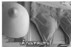
เต้านมทดแทน