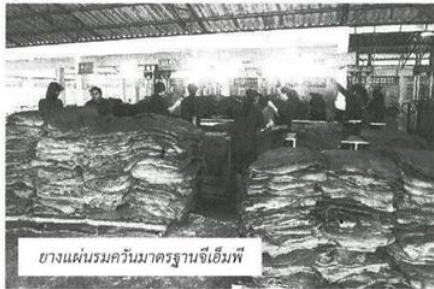
ยางแผ่นรมควันมาตรฐานจีเอ็มพี

ที่เน้นกระบวนการบริหารโดยผ่านระบบเอกสารไม่ได้เจาะลึกในรายละเอียดคุณภาพยางที่ผลิต"