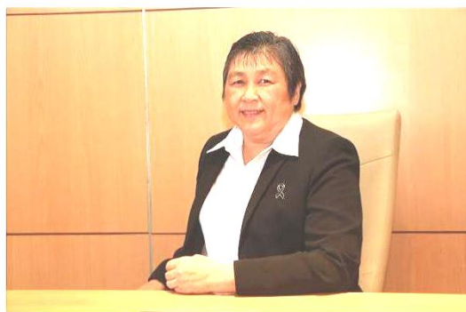
กรุงเทพฯ-25 ธ.ค.-การยางแห่งประเทศไทย

การยางแห่งประเทศไทย แนะนำเกษตรกรชาวสวนยางทั่วประเทศ ผลิตยางก้อนอย่างมีคุณภาพ ไม่สอได้สอยางตาย หลังพบในบางพื้นที่ มีการส่งขายยางก้อนไม่มีคุณภาพ เดือน อาจส่งผลกระทบต่อ การส่งออกยางและความเชื่อมั่นของคู่ค้า ทั้งนี้ กยท. ทุกจังหวัด จะติดตามเร่งประชาสัมพันธ์สร้างความรู้ความเข้าใจที่ถูกต้องแก่เกษตรกรชาวสวนยาง