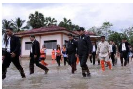
The right to the photo comes in: Photograph shows thousands of people in Thailand in response to the impact of flood disaster.

Poverty is a contributing factor in vulnerability to these disasters because it limits income earning options. The poor are much more likely to cope by reducing spending on education and health, which in turn further weakens their recovery and reinforces the transmission of inter-generational poverty in irreversible ways. Monetary values attached to disaster losses seriously underestimate the links between poverty and disasters.