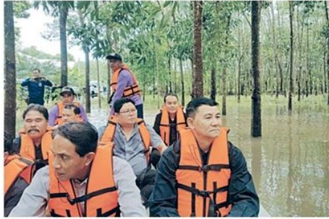
ลงพื้นที่ดูความเสียหาย