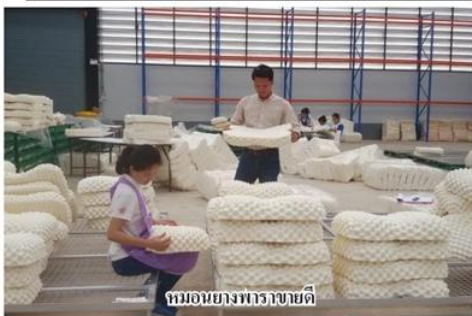
หมอนยางพาราชนิด

อย่างไร โดยเฉพาะอย่างยิ่งเราเห็นความสำคัญในเรื่องของการแปรรูปยางพารา และการพัฒนางานวิจัยเพื่อเพิ่มมูลค่ายางพาราเชื่อมั่นว่า ยางพาราจังหวัดบึงกาฬจะเป็นจุดสำคัญของพี่น้องชาวสวนยางทั่วประเทศ เพราะเป็นเวทีที่จะหาแนวทางในการทำงานร่วมกัน