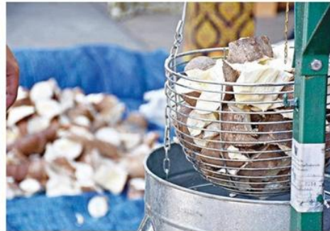
ตรวจสอบน้ำหนักมันสำปะหลัง