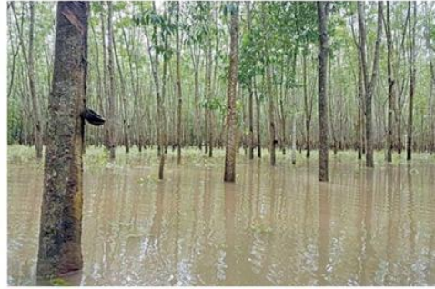
สภาพสวนยางที่ได้รับความเสียหาย

สถานการณ์อุทกภัยในพื้นที่ภาคใต้ครั้งนี้ ตั้งแต่ปลายปี 2559 จนกระทั่งต้นปี 2560 สร้างความเสียหายทั้งภาคเกษตรและอุตสาหกรรม โดยเฉพาะอย่างยิ่งพืชเกษตรอย่างยางพารา ซึ่งเป็นพืชเศรษฐกิจสำคัญของประเทศและเป็นอาชีพหลักของเกษตรกรในพื้นที่ได้รับความเสียหายมากที่สุดในรอบ 20 ปี มีพื้นที่ประมาณ 1,087,369 ไร่ มีพี่น้องชาวสวนยางที่ได้รับความเสียหายรวมประมาณการในเมืองต้น 133,367 รายจากพื้นที่ 12 จังหวัดภาคใต้