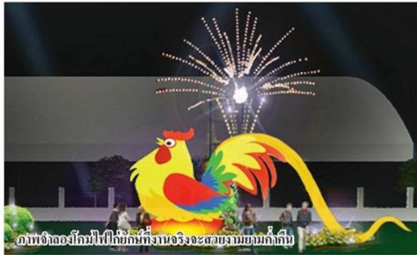
ภาพจำลองโคมไฟไปรษณีย์ที่งานจริงจะสวยงามขมก่กิ้น

ปลูกและกรีดยางพาราเอง แต่เดี๋ยวนี้อาจมีโอกาสได้ขายเองด้วย จะเป็นการเพิ่มจีดีพีต่อหัวได้อย่างก้าวกระโดด การจัดงานมาตลอด 4 ปีที่ผ่านมา ต้องขอรับความสามัคคีของพี่น้องชาวบึงกาฬ โดยความร่วมมือในนามชุมชนสหกรณ์ยางบึงกาฬ ก่อตั้งขึ้นมาเพื่อสู้เงินจาก ธ.ก.ส. แต่วันนี้พิสูจน์ความสามารถของชาวสวนยาง