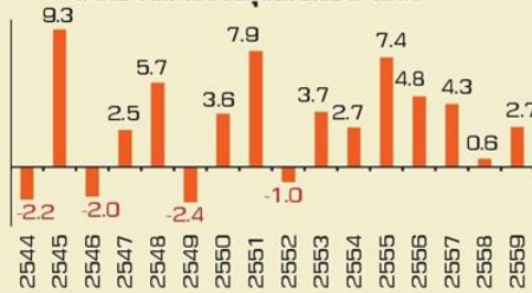
ผลตอบแทนตลาดหุ้นไทยเดือน ก.พ. (หน่วย %)

สำหรับปีนี้อัตราผลตอบแทนจากเงินปันผลยังอยู่ในเกณฑ์ที่ดี แม้จะไม่สูงเหมือนช่วงหลายปี ขณะที่เราเห็นการปรับขึ้นประมาณการกำไรในหุ้นหลายกลุ่ม เช่น พลังงาน (ราคาพลังงานปรับสูงขึ้น) ธนาคาร (ปัญหา NPL ผ่านจุดที่แย่สุดไปแล้ว และเริ่มมีสัญญาณบวกทางเศรษฐกิจ) โรงพยาบาลที่ให้บริการประกันสังคม ลือ (การใช้งบประมาณเริ่มฟื้น)