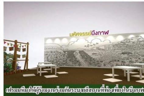
นิทรรศการที่ผู้ร่วมงานร่วมกันระดมความคิดเห็นที่ห้องประชุมบึงกาฬ