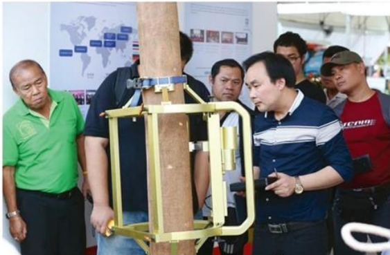
นวัตกรรมเครื่องรีดยางต้องมานั้นในงานนี้