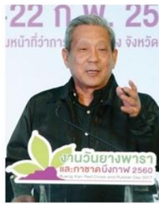
ทินิจ จารุสมบัติ

ในฐานะผู้ริเริ่มการจัดงานตั้งแต่ครั้งแรก นายทินิจ จารุสมบัติ อธิบดีรองนายกรัฐมนตรี ออกตัวว่างานยางพาราบึงกาฬไม่ใช่แค่งานระดับชาติ แต่เป็นงานระดับโลก แม้พื้นที่จ.บึงกาฬ จะปลูกยางพาราเป็นอันดับ 1 ของภาคอีสาน แต่กลับสร้างจีดีพีให้ประเทศมหาศาล และยังสร้างงานสร้างรายได้ให้กับ