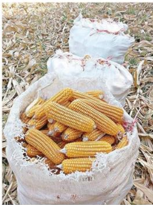
ข้าวโพดเลี้ยงสัตว์

หากเทียบกับเดือนพฤศจิกายน 2559 ที่ผ่านมา ภาพรวมดัชนีราคาเพิ่มขึ้น ร้อยละ 7.24 สินค้าที่ราคาปรับตัวสูงขึ้น ได้แก่ ข้าว เปลือกเจ้าความชื้น 15% ราคาเพิ่มขึ้นเนื่องจาก