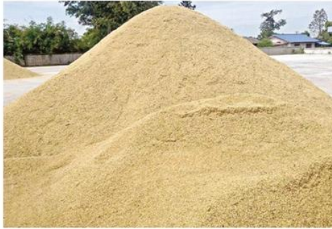
ลานตากข้าวเปลือก