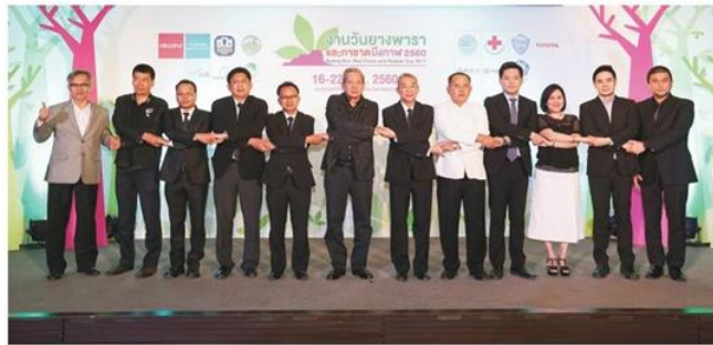
ร่วมมือ - บมจ.มิติน ร่วมกับจังหวัดบึงกาฬ หน่วยงานภาครัฐและเอกชน จัดงาน “วันยางพาราและกาชาดบึงกาฬ 2560” ในงานมีสัมมนาวิชาการและความบันเทิงเต็มรูปแบบ

หัวข้อข่าว: บึงกาฬจัดใหญ่วันยางพาราและกาชาด2560ชวนวัดกรรมใหม่-บันเทิงเต็มสูบ