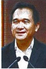
คลังคยศัญญาณศก.ฟื้น รับยอดเก็บ VAT- ลงทุน-ส่งออกม.ค.พุง