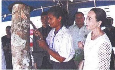
นักเรียน รร.สตรีพิ้งงา สังกัด สพม.เขต 14 (พิ้งงา ภูเก็ต ระนอง) สาธิตวิธีการกรีดยางพารา ซึ่งเป็นอาชีพหลักของชาวภาคใต้ในงาน "เปิดบ้านสตรีพิ้งงา" เมื่อเร็วๆ นี้