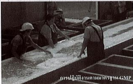
การปฏิบัติงานตามมาตรฐาน GMP

กระบวนการรับรองมาตรฐาน GMP สำหรับการผลิตยางแผ่นรมควัน จะเริ่มตั้งแต่รับผลผลิต (น้ำยาง) คุณภาพน้ำยาง การขนส่งไปยังโรงงานผลิตยางแผ่นรมควันต้องทำอะไร และเมื่อไปถึงโรงงานแล้วจะเข้าสู่กระบวนการแปรรูป