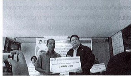
การยกย่องประเทศไทย (กยท.) มอบเงินช่วยเหลือเกษตรกรชาวสวนยาง เพื่อบรรเทาความเดือดร้อนกรณีสวนยางประสบภัย