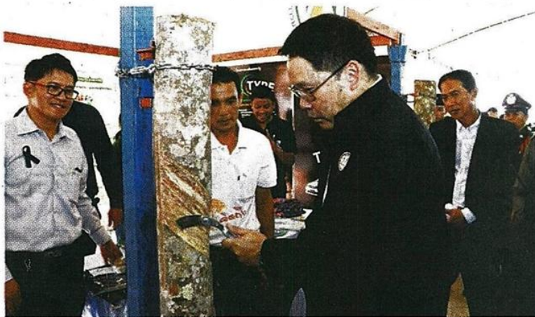
กรัตติยาง : นายอุดม สาบานาน รัฐมนตรีว่าการกระทรวงอุตสาหกรรม ทดลองกรัตติยางพารา หลังเป็นประธานเปิดโครงการ "กนอ.สานพลังประชารัฐ ยกระดับเอสเอ็มอียางไทย ก้าวไกลในนิคมอุตสาหกรรมยางพารา (รับเบอร์ชิตี)" ที่จ.สงขลา วานนี้ (31 พ.ค.)

นอกจากนี้ บอร์ดกนอ. อยู่ระหว่างการศึกษาที่จะขยายพื้นที่นิคมรับเบอร์ชิตีเพิ่มในภาคใต้ โดยได้มองพื้นที่ในเขตเศรษฐกิจพิเศษชายแดน คือ อ. ยี่งอ จ. นราธิวาส เพื่อรองรับอุตสาหกรรมยางพารา แปรรูปอาหาร