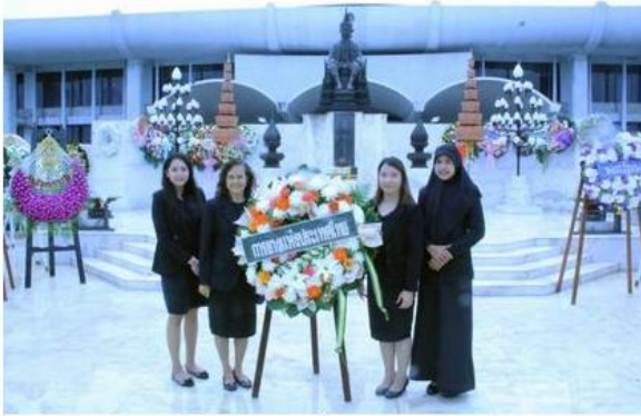
ดูรูปทั้งหมด

ข่าวทั่วไป ThaiPR.net -- พุธที่ 31 พฤษภาคม 2560 15:45:23 น.