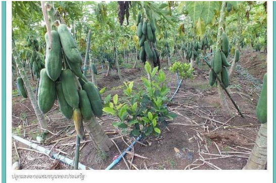
ปลูกมะละกอแซมสวนยางของประเสริฐ

คุณจอม และคุณลักษณะ เล่าให้ฟังว่า เดิมทีสวนแห่งนี้มีรายได้หลักจากการทำสวนยาง เนื้อที่ 30 ไร่ ต่อมาเจอวิกฤตราคา ยางตกต่ำ จึงตัดสินใจโค่นต้นยางอายุ 16-17 ปี เนื้อที่ 20 ไร่ ทั้ง เพื่อนำที่ดินดังกล่าวมาปลูกพืชผสมผสาน ตามหลักเศรษฐกิจ พอเพียง สวนยางที่เหลืออยู่เป็นยางต้นเล็กที่ยังไม่ครบอายุเปิดกรีด