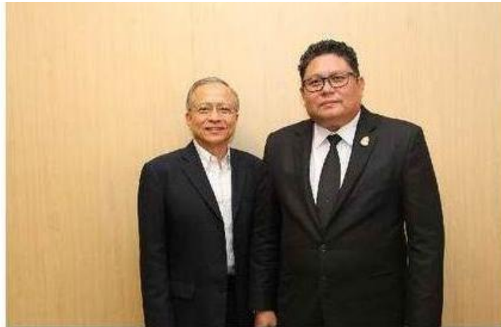
ครบทั้งหมด

ThaiPR.NET กยท. เชิญ ผู้ประกอบการยางรายใหญ่ Thailand Press Release (กลุ่มสมาชิก) ของประเทศ เจาะปัญหาการร่วงผิดปกติ เตรียมเดินทางมาตรวจการเร่งด่วน สร้างเสถียรภาพด้านราคา