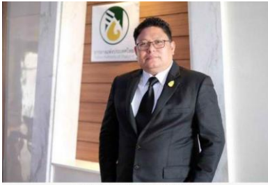
ดร.อี๊ด อึ้งสาสะนา ผู้อำนวยการการยางแห่งประเทศไทย

การยางแห่งประเทศไทย เร่งลงพื้นที่ 7 เขต ทั่วประเทศ ประชุมชี้แจง หลักเกณฑ์และวิธีการใช้จ่ายเงิน จากกองทุนพัฒนายางพารา ตามมาตรา 49 (3) (5) และ (6) แก่เกษตรกรสามารถดำเนินการได้ทันที เกษตรกรสามารถเข้าถึงกองทุนพัฒนายางฯ ตามวัตถุประสงค์พ.ร.บ.การยางแห่งประเทศไทย พ.ศ.2558