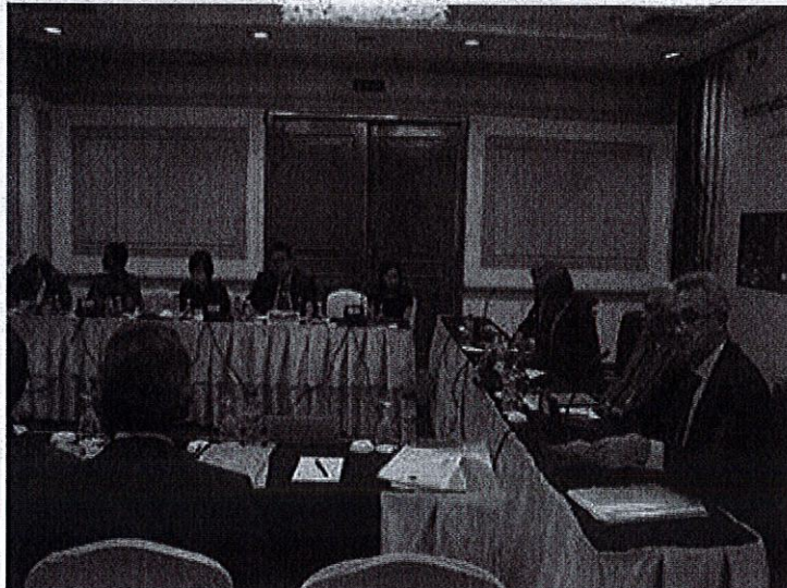
รูปทั้งหมด

ข่าวทั่วไป ThaiPR.net -- ศุกร์ที่ 27 ตุลาคม 2560 14:03:17 น.