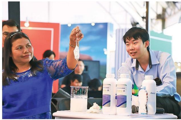
สารจับยาง IR มจพ.

ราคายางพารา ถึงแม้ไม่ได้มาร่วมจัดแสดงโชว์นวัตกรรมในงานวันยางพาราครั้งนี้ แต่ก็มีแนวคิดและงานวิจัยดีๆ มาร่วมแลกเปลี่ยนเช่นกัน