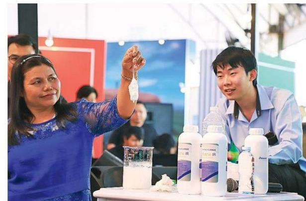
สารจับยาง IR มจพ.

ราคายางพารา ถึงแม้ไม่ได้มาร่วมจัดแสดงโชว์นวัตกรรมในงานวันยางพาราครั้งนี้ แต่ก็มีแนวคิดและงานวิจัยดีๆ มาร่วมแลกเปลี่ยนเช่นกัน