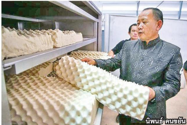
นิพนธ์ คนขยัน

หัวข้อข่าว: ไฮไลต์เด็ด! วันยางพาราบึงกาฬ 2561 ครบเครื่องนวัตกรรมเพื่อ 'ชาวสวนยาง'