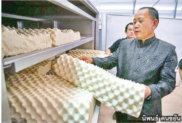
นิพนธ์ คนขยัน

หัวข้อข่าว: ไฮไลต์เด็ด! วันยางพาราบึงกาฬ 2561 ครบเครื่องนวัตกรรมเพื่อ 'ชาวสวนยาง'