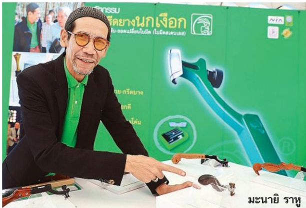
มนะยิ ราหู

ขณะที่ จังหวัดบึงกาฬ เจ้าบ้านก็ไม่น้อยหน้า เมื่อถึงงานวันยางพาราทั้งที่ก็มีนวัตกรรมที่เป็นผลผลิตของชาวสวนยางในจังหวัดที่ได้รับการสนับสนุนจากองค์กรท้องถิ่นอย่างต่อเนื่อง