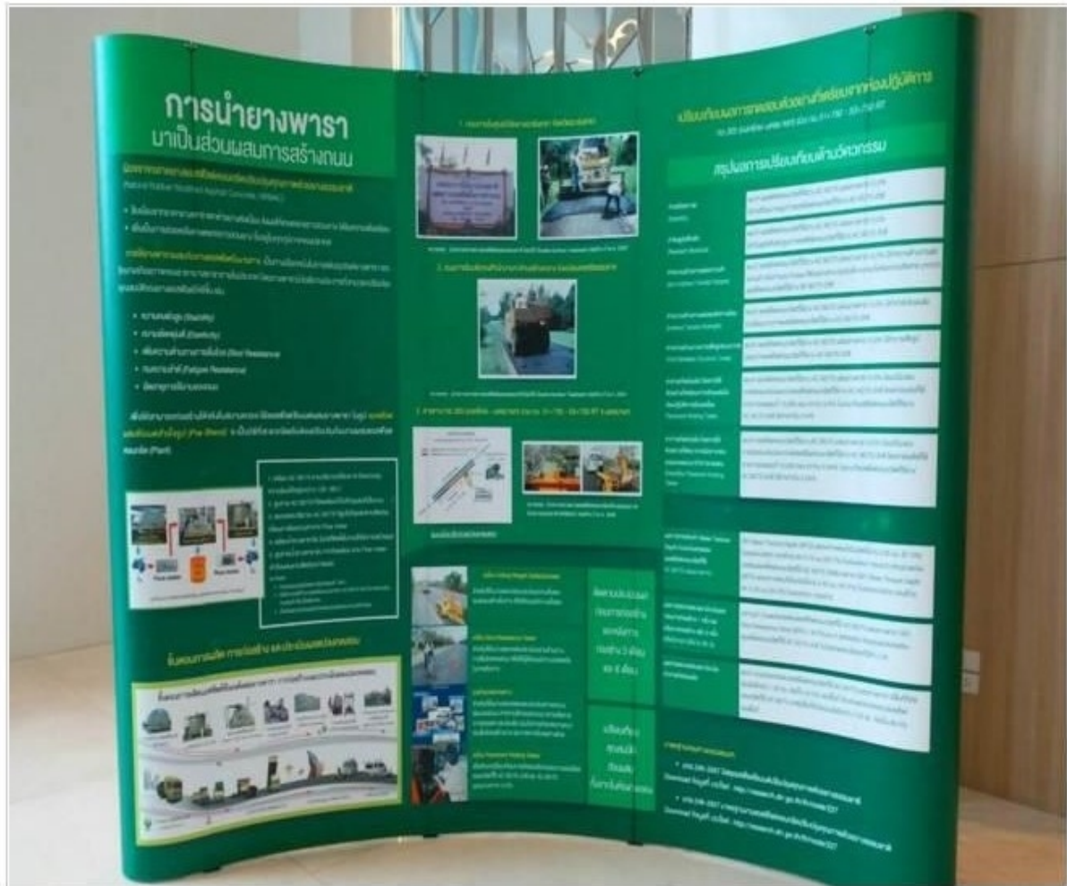
ข่าวโดย ผู้สื่อข่าว : สุธิดา พฤกษ์อุดม สวท.สงขลา

หัวข้อข่าว: ท้องถิ่นร่วมกับ อบจ. ให้ความรู้ทำโครงที่มีส่วนผสมของยางพารา เดินหน้าช่วยชาวสวนยาง