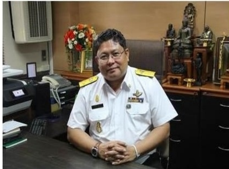
รูปทั้งหมด

ข่าวทั่วไป ThaiPR.net -- พุทธศักราช 2561 25 มกราคม 2561 16:41:42 น.