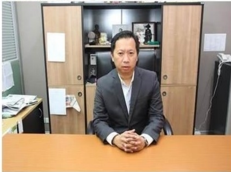
รูปทั้งหมด

ข่าวทั่วไป ThaiPR.net -- พุธที่ 14 กุมภาพันธ์ 2561 14:12:31 น.