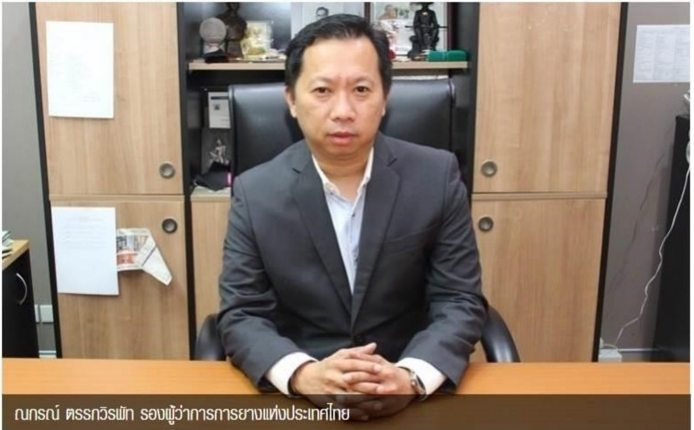
คุณกรณ์ ตรรกวิรพัท รองผู้ว่าการการยางแห่งประเทศไทย

เกษตร/ทำกิน/สัตว์เลี้ยง : 16 ชั่วโมงที่ผ่านมา