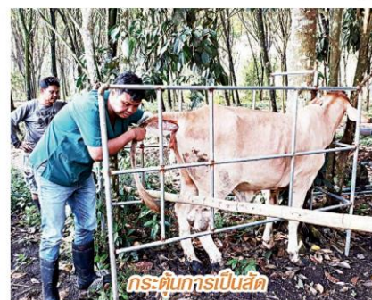
กระต๊อบกรเป็นสัตว์

สำหรับปริมาณการบริโภคเนื้อโคของโลกโดยเฉลี่ยจะอยู่ที่ประมาณ 56.96 ล้านตันต่อปี และมีแนวโน้มการผลิตและการบริโภคเพิ่มขึ้นอย่างต่อเนื่อง ซึ่งประเทศที่ผลิตเนื้อโคสูงสุดของโลก ได้แก่ สหรัฐ อินเดีย และบราซิล โดยบราซิลจะเน้นการส่งออกเป็นหลัก.