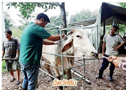
อีดัวชัย

เมื่อเกษตรกรส่วนใหญ่เปลี่ยนไปทำสวนยางกันมากขึ้น ทำให้ปริมาณโคเนื้อในไทยมีจำนวนลดลง จากอดีตเมื่อ 10 ปีที่แล้วมีโคอยู่ในประเทศประมาณ 8.03 ล้านตัว ปัจจุบันลดเหลือ 3 ล้านกว่าตัว แต่เมื่อราคายางพารามีความผันผวนมาก เกษตรกรส่วนหนึ่งจึงหันมาเลี้ยงโคเนื้ออีกครั้งหนึ่ง