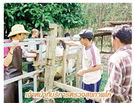
เจ้าหน้าที่กับบริการตรวจสุขภาพโค

เพื่อตอบสนองความต้องการของเกษตรกรในเรื่องนี้ทางรัฐบาลจึงได้จัดโครงการสร้างอาชีพเลี้ยงโคเนื้ออย่างยั่งยืนในพื้นที่เขตภาคตะวันออกและภาคใต้ โดยเน้นส่งเสริมเกษตรกรที่ปลูกยางพาราและสนใจเลี้ยงโค พร้อมยอมปรับเปลี่ยนพื้นที่ปลูกยางพารา