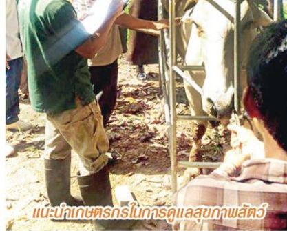
แนะนำเกษตรกรในการดูแลสุขภาพสัตว์