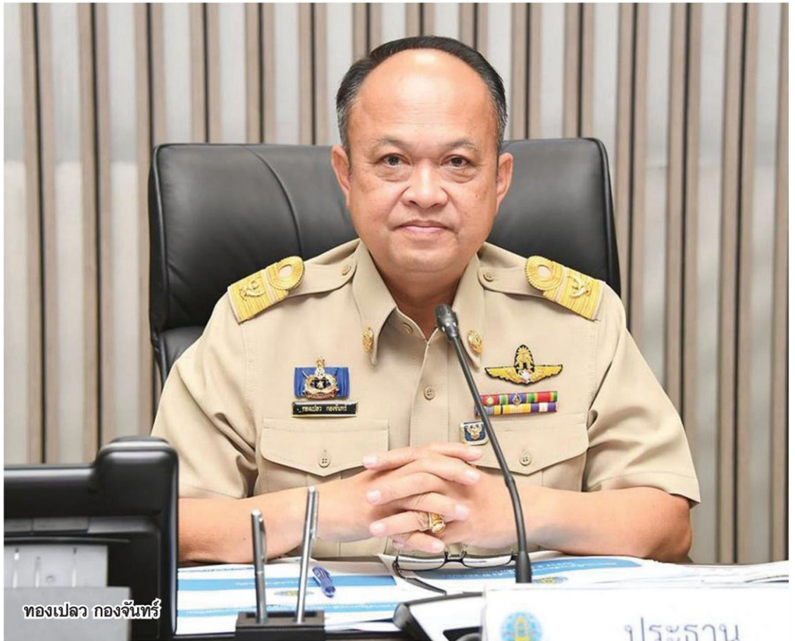
ทองเปลว กองจันทร์

หมายเหตุ - นายทองเปลว กองจันทร์ อธิบดีกรมชลประทาน แถลงถึงการติดตามสถานการณ์น้ำในช่วงฤดูแล้ง และวิเคราะห์การบริหารจัดการให้เหมาะสมกับช่วงเวลา ที่ศูนย์ปฏิบัติการน้ำอัจฉริยะ กรมชลประทาน เมื่อวันที่ 26 กุมภาพันธ์