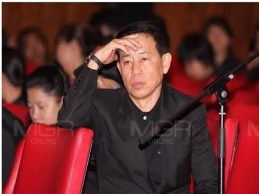
พล.ท.สรรเสริญ แก้วกำเนิด โฆษกประจำสำนักนายกรัฐมนตรี (แฟ้มภาพ)

เผยแพร่: 27 ก.พ. 2561 18:44: ปรับปรุง: 27 ก.พ. 2561 19:05: โดย: MGR Online