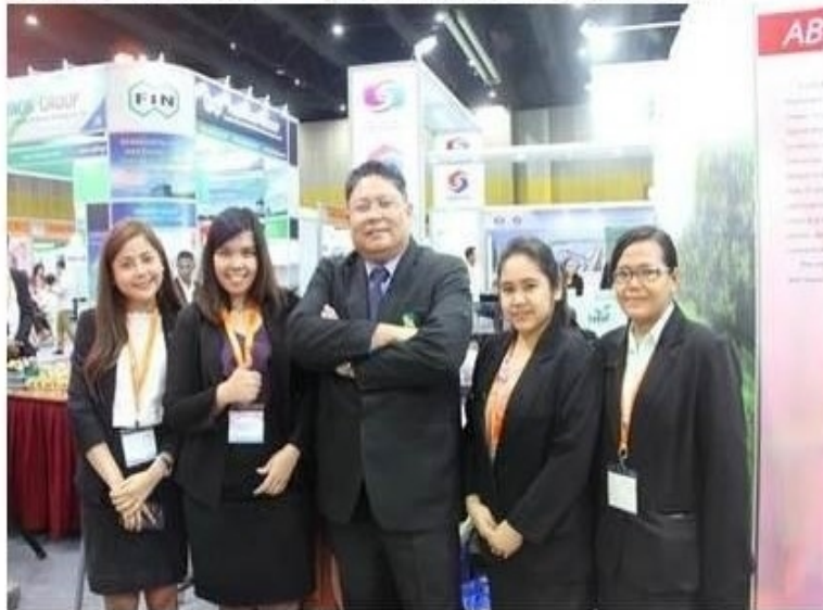
ดูรูปทั้งหมด

ข่าวทั่วไป ThaiPR.net -- พุธที่ 14 มีนาคม 2561 15:32:33 น.