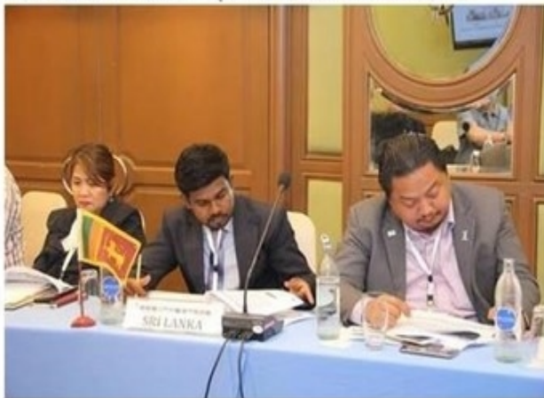
ครบทั้งหมด

ข่าวทั่วไป ThaiPR.net -- พุธที่ 14 มีนาคม 2561 12:13:47 น.