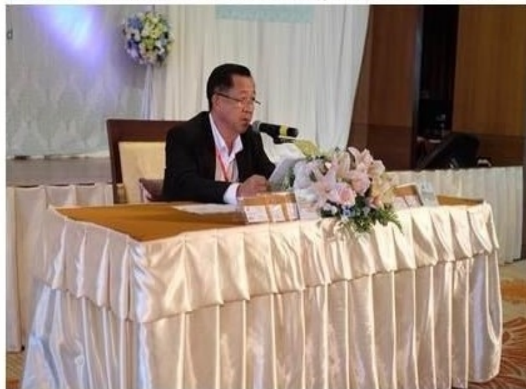
รูปทั้งหมด

ข่าวทั่วไป ThaiPR.net -- จันทร์ที่ 2 กรกฎาคม 2561 15:20:47 น.