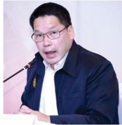
'อุตตม'หนุนตั้งธง.รีไซเคิล เพิ่มมูลค่าศก.5ปี1แสนล้าน