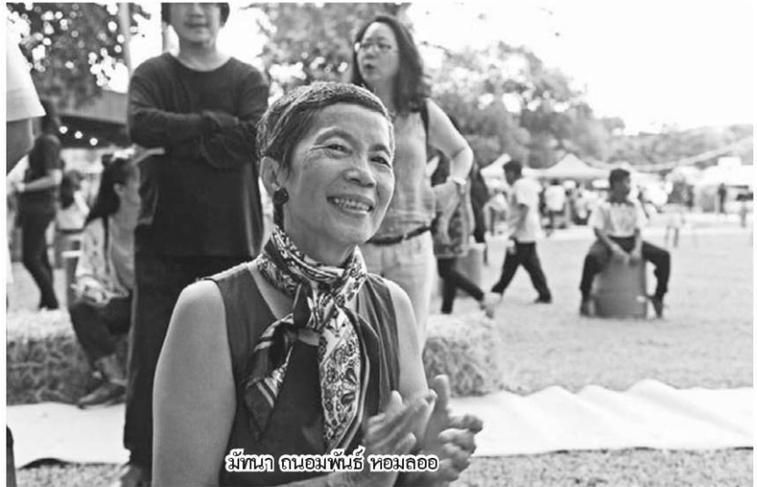
มีทนา งามอมพันธ์ หอมล่อ