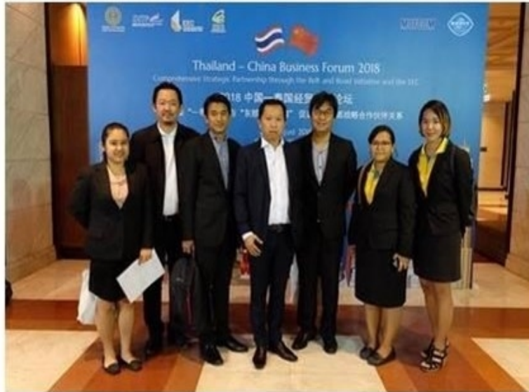
ครบทั้งหมด

ข่าวทั่วไป ThaiPR.net -- พุธที่ 29 สิงหาคม 2561 16:23:35 น.