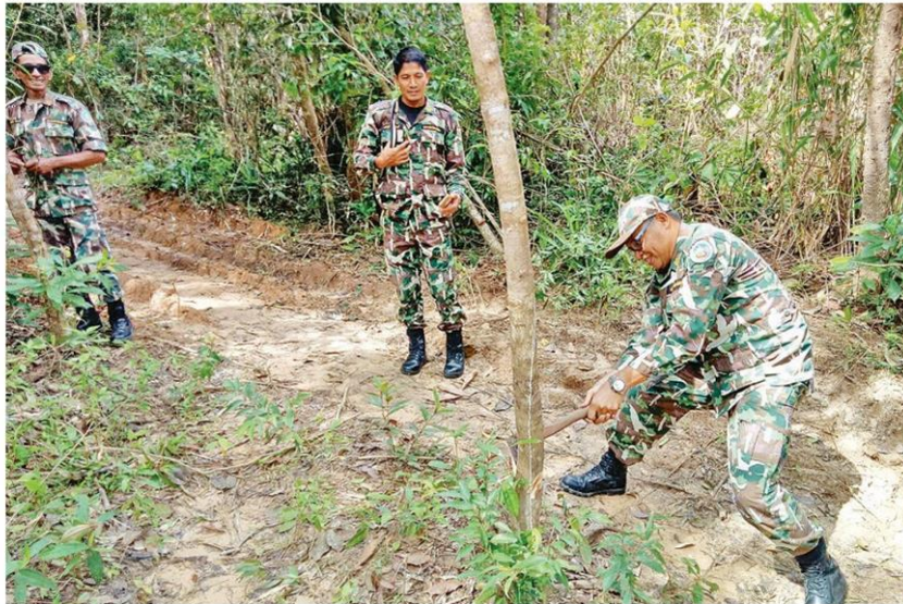
ยึดคืนผืนป่า - เจ้าหน้าที่อุทยานแห่งชาติหาดเจ้าไหม สนธิกำลังเจ้าหน้าที่หน่วยต่างๆ กว่า 100 นาย เข้ารื้อถอนทำลายสวนยางพารา ในพื้นที่หมู่ 5 ต.ไม้ฝาด อ.สิเกา จ.ตรัง เนื้อที่กว่า 82 ไร่ ที่บุกรุกเขตอุทยานฯ เมื่อวันที่ 25 กันยายน

“การยึดพื้นที่ป่าคืนจากนายทุนและชาวบ้านที่บุกรุกพื้นที่อุทยานแห่งชาติ เป็นนโยบายเกี่ยวกับการปราบปรามและหยุดยั้งการทำลายทรัพยากรป่าไม้ การบุกรุกที่ดินของรัฐ และการบริหารจัดการทรัพยากรธรรมชาติและสิ่งแวดล้อมอย่างยั่งยืนของรัฐบาล จังหวัดตรังมีการประชุมคณะทำงานฝ่ายอำนวยการ ตามคำสั่งศาลจังหวัดตรัง ที่ 2197/2558 ลงวันที่ 11 สิงหาคม 2558 เมื่อวันที่ 15 สิงหาคม 2561 เพื่อดำเนินการตามนโยบายของรัฐบาลในการแก้ปัญหาทรัพยากรป่าไม้ได้อย่างสัมฤทธิ์และเป็นรูปธรรม หลังยึดคืนพื้นที่ป่าและตัดโค่นต้นยางพาราแล้ว จะมิแผนปลูกต้นไม้เพื่อทดแทนต้นไม้ที่ถูกตัดโค่นต่อไป” นายณรงค์กล่าว